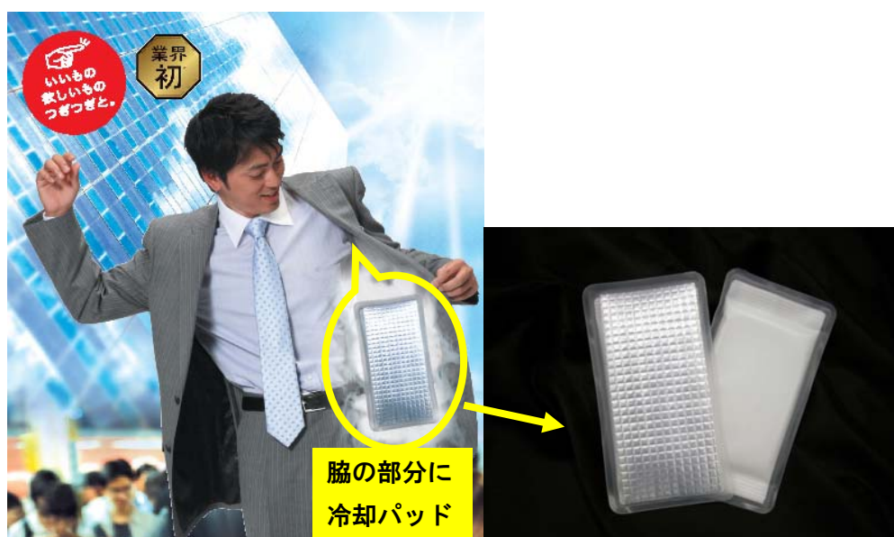
冷却パッド使用の新アイススーツ

この度発売する「新アイススーツ」は、モーターレースや消防服用などの冷却着衣や特殊防護服などの熱中症対策にも使われている冷却素材で、スーツの生地だけでは得られないパッシブな吸熱効果が得られるものです。当社が超薄型軽量化を図り、スーツ用に専用開発したクールパックをスーツの熱のこもりやすい両脇の部分に装着することで、スーツ内部の熱や体の熱を奪い、快適性・機動性を重視したものです。猛暑日や蒸し暑い夏または、自転車通勤などでスーツを着用するシーンで、体のほてりをクールダウンする業界初の冷房機能付の夏専用スーツです。